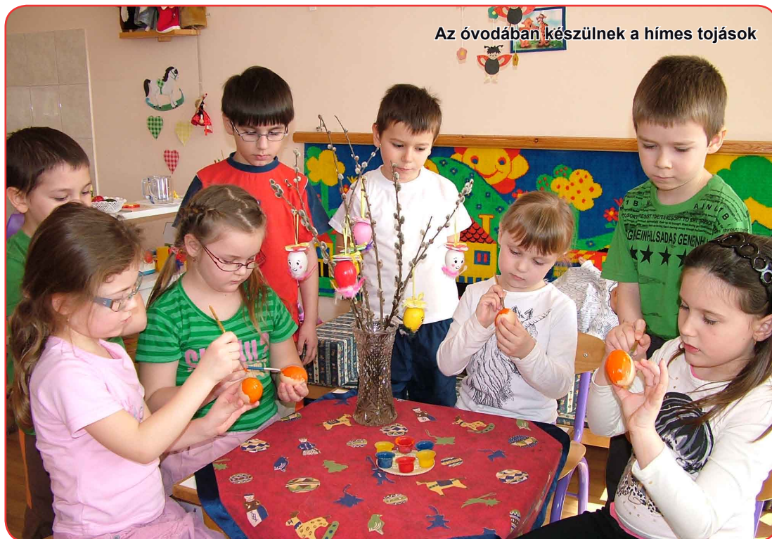
Az óvodában készülnek a hímes tojások