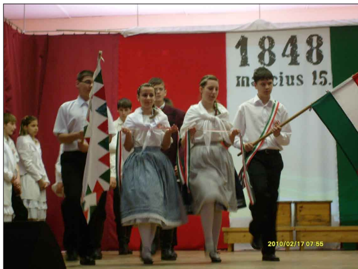
A Móra Ferenc Általános Iskola, Gimnázium és Alapfokú Művészeti Iskola diákjai nagy átéléssel jelenítették meg Széchenyi, Kosuth, Petöfi, Jókai szellemiségét az 1848-as emlékműsorban