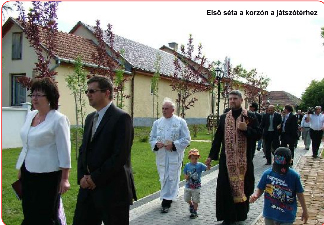
Első séta a korzón a játszótérhez