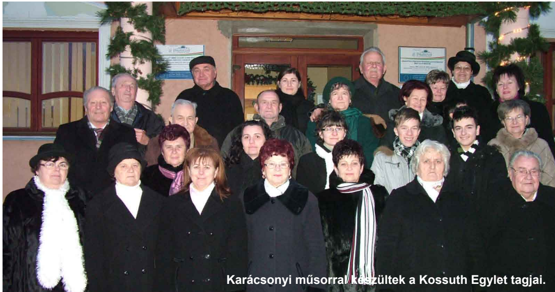
Karácsonyi műsorral készültek a Kossuth Egylet tagjai.