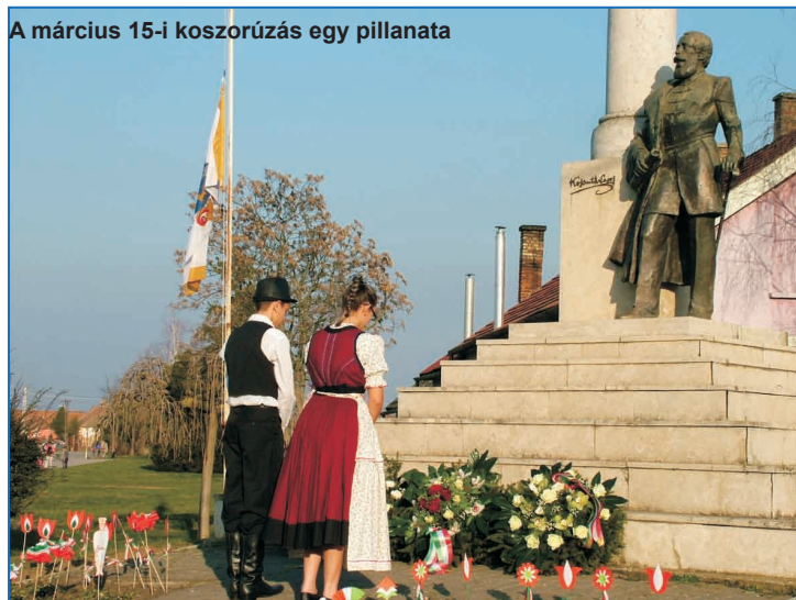
A március 15-i koszorúzás egy pillanata

Rendezvényeinkre továbbra is várjuk a lakosságot.