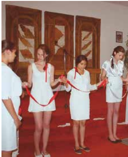
Nemzeti összetartozás napja: 2016. június 4-e