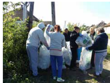
Roma Nemzetiségi Önkormányzat

hogyan legyen. A jövőnk érdekében erre már egészen fiatal korban fel kell hívni a figyelmet és példamutatással el kell érni, hogy a környezettudatosság a mindennapok alapjává váljon. A kezdeményezést sikeresnek ítéljük, mert a jó hangulatú eseményen több család környezetét tettük tisztábbá és élhetőbbé. Ezúton is szeretnénk köszönetet mondani a Kicsi Konyhának, illetve a Gyulaházi Pékség dombrádi boltjának a természetben nyújtott támogatásért. Köszönjük továbbá Gombos Attila János alpolgármester úr támogatását is, amely ugyancsak hozzájárult a nap hangulatához. Önkormányzatunk Dombrád Város Önkormányzatának jóvoltából az előzőnél esztétikai és környezeti szempontból is jobb adottságokkal rendelkező, új irodába költöztetett a Kölcsey út Nemzetiségi Önkormányzatunk ellenszolgáltatás nélkül vállalta, hogy a közmunkára ítéltetett városunkban foglalkoztatja. Segíteni kívánjuk ezzel a közmunkára ítéltetett, hogy a bíróság által kiszabott közmunka-végzési kötelezettségüknek helyben, nem pedig naponta több tíz kilométert utazva tudjanak eleget tenni.