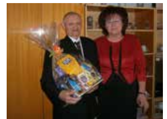
Városvezetői köszöntés a 90. születésnapon

vizsgálatra. Csütörtökön 8 és 13 óra között Ruhabörzét tartottak a Művelődési Ház és Könyvtár épületében. Az egész hetes rendezvény zárónapján, pénteken a dombrádi Móra Ferenc Általános Iskola, Gimnázium és Alapfokú Művészeti Iskola gimnazistái részvételével Szociopoli társasjátékok bonyolították a szervezők.