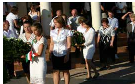
a megemlékezést a felújított I. Világháborús Emlékmű koszorúzása zárta.