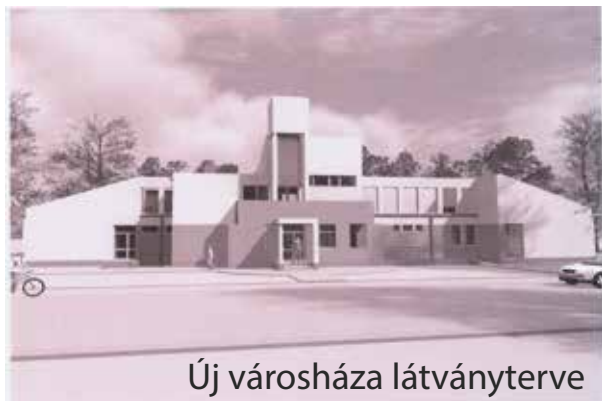
Új városháza látványterve