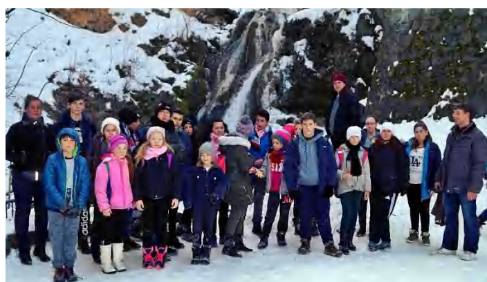
Téli túra Felsőháromon