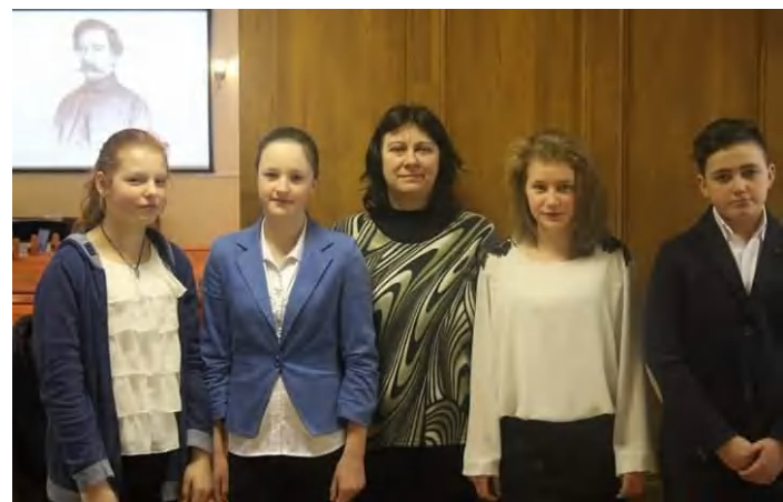
Arany János Balladamondó verseny Karcag